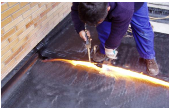
Fig. 2: Proceso de colocación de una lámina impermeabilizante