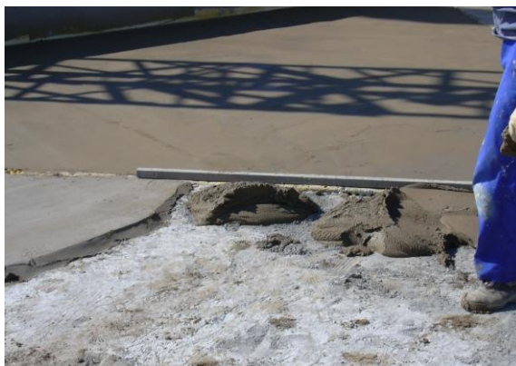
Fig. 1: Ejecución de paños de la formación de pendientes