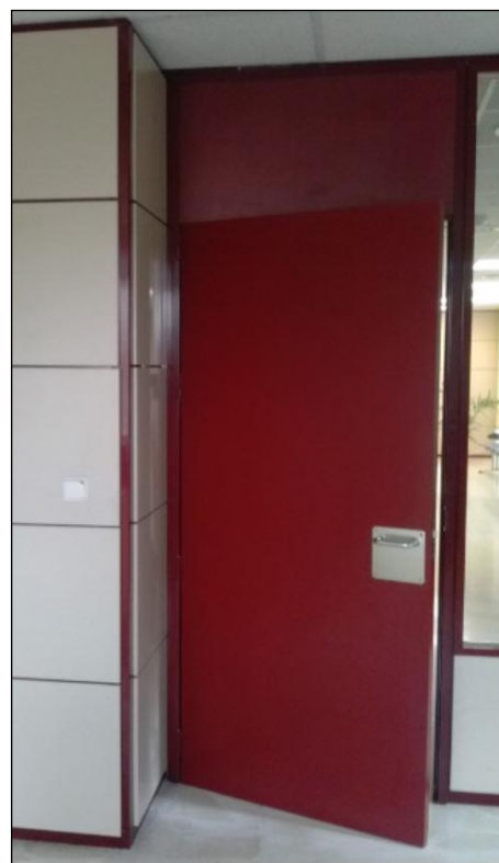
Fig. 3: Puerta de oficina con un fijo hasta el techo en la parte superior

Por el contrario, será necesario incluir otros parámetros adicionales que son propios de los frentes de armario para que los mismos queden totalmente definidos. Se trata del parámetro 13, que es la clasificación 'Según la compartimentación del frontal' -CF-. Existen dos posibilidades: que el frontal sea 'enterizo' (z) [aunque el interior del armario esté subdividido]; o que el frontal tenga un 'altillo' (ll) [una hoja independiente más pequeña encima de la hoja principal]. De esta forma, la codificación de un armario con frontal enterizo sería: CF(z).