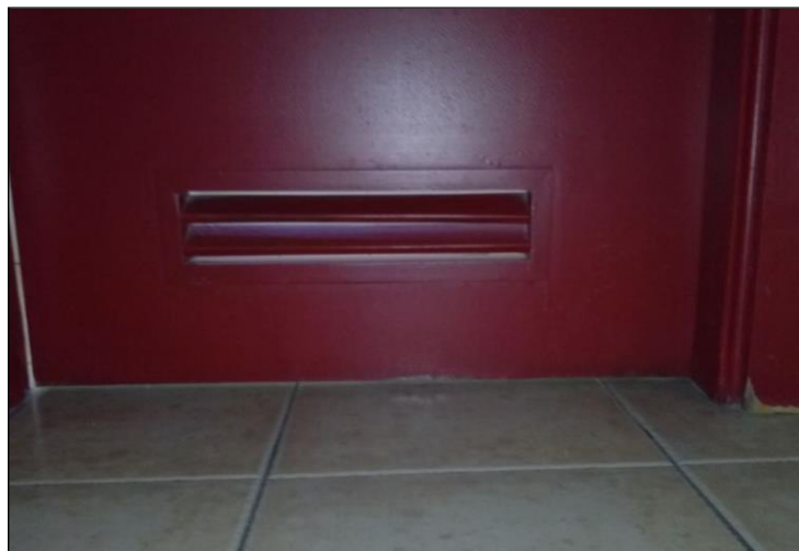
Fig. 5: Colocación de una abertura de paso integrada en la parte inferior de una puerta. Las lamas de la rejilla están fabricadas en madera y a doble cara.