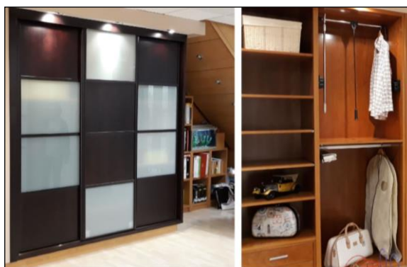
Fig. 2: Vista de la carpintería de dos armarios: exterior e interior