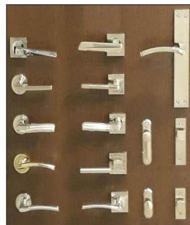
Fig. 7: Muestrario de distintos tipos de manillas para puertas

En el punto 3.1.2.3.4.4 (condiciones mínimas de los elementos de separación verticales) se expresa que: de acuerdo con lo establecido en el apartado 2.1.1 de este DB-HR, las puertas que comunican un recinto protegido de una unidad de uso con cualquier otro del edificio que no sea recinto de instalaciones o de actividad, deben tener un índice global de reducción acústica ponderado A, ( R_A ) no menor que 30dBA. Por su parte, si las puertas comunican un recinto habitable de una unidad de uso en un edificio de uso residencial u hospitalario con cualquier otro del edificio que no sea recinto de instalaciones o de actividad, su índice global de reducción acústica ponderado A, ( R_A ) no será menor que 20dBA. Si las puertas comunican un recinto habitable con un recinto de instalaciones o de actividad , su índice global de reducción acústica ponderado A, ( R_A ) no será menor que 30dBA.