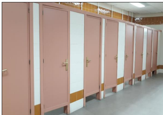
Fig. 1: Carpintería interior: puertas de un aseo público

Algunas de las deficiencias debidas a errores de proyectos son: no colocar puertas resistentes al fuego allí donde la normativa lo exige, o colocarlas con un grado inferior al requerido; anchos de puertas inferiores al que se determina según el cálculo de la evacuación; no prever la colocación de aberturas de paso para la ventilación interior de las viviendas; herrajes de calidad cuestionables, diseños y dispositivos de accionamiento que no evitan el riesgo de atrapamiento; inclusión de una tipología de vidrio inadecuada; ancho de precerco mayor o menor al grosor de la tabiquería donde irá colocada; falta de colocación de bandas de protección metálica en zonas con riesgo de impactos (p. ej. en puertas de hospitales), etc.