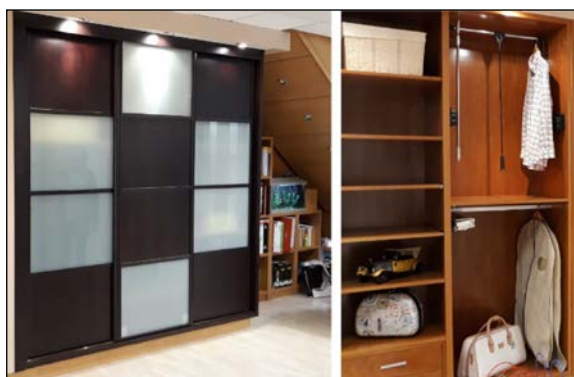
Fig. 2: Vista de la carpintería de dos armarios: exterior e interior