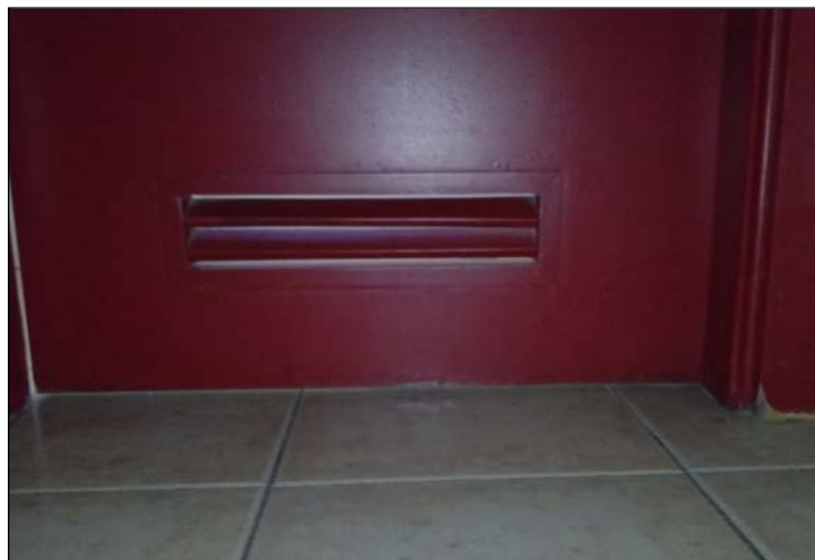
Fig. 5: Colocación de una abertura de paso integrada en la parte inferior de una puerta. Las lamas de la rejilla están fabricadas en madera y a doble cara.