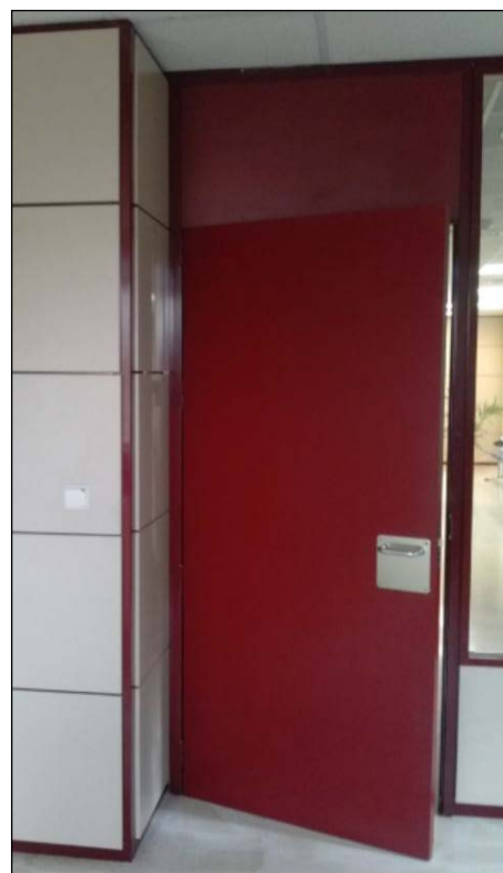
Fig. 3: Puerta de oficina con un fijo hasta el techo en la parte superior

Por el contrario, será necesario incluir otros parámetros adicionales que son propios de los frentes de armario para que los mismos queden totalmente definidos. Se trata del parámetro 13, que es la clasificación 'Según la compartimentación del frontal' -CF-. Existen dos posibilidades: que el frontal sea 'enterizo' (z) [aunque el interior del armario esté subdividido]; o que el frontal tenga un 'altillo' (ll) [una hoja independiente más pequeña encima de la hoja principal]. De esta forma, la codificación de un armario con frontal enterizo sería: CF(z).