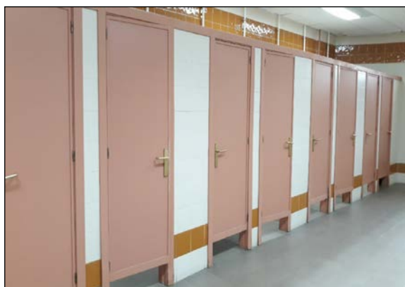
Fig. 1: Carpintería interior: puertas de un aseo público

Algunas de las deficiencias debidas a errores de proyectos son: no colocar puertas resistentes al fuego allí donde la normativa lo exige, o colocarlas con un grado inferior al requerido; anchos de puertas inferiores al que se determina según el cálculo de la evacuación; no prever la colocación de aberturas de paso para la ventilación interior de las viviendas; herrajes de calidad cuestionable, diseños y dispositivos de accionamiento que no evitan el riesgo de atrapamiento; inclusión de una tipología de vidrio inadecuada; ancho de precerco mayor o menor al grosor de la tabiquería donde irá colocada; falta de colocación de bandas de protección metálica en zonas con riesgo de impactos (p.ej. en puertas de hospitales), etc.