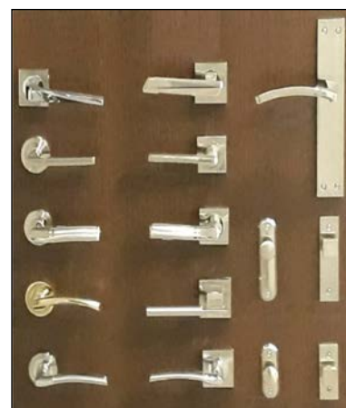
Fig. 7: Muestrario de distintos tipos de manillas para puertas

En el punto 3.1.2.3.4.4 (condiciones mínimas de los elementos de separación verticales) se expresa que: de acuerdo con lo establecido en el apartado 2.1.1 de este DB-HR, las puertas que comunican un recinto protegido de una unidad de uso con cualquier otro del edificio que no sea recinto de instalaciones o de actividad, deben tener un índice global de reducción acústica, ponderado A, ( R_A ) no menor que 30dBA. Por su parte, si las puertas comunican un recinto habitable de una unidad de uso en un edificio de uso residencial u hospitalario con cualquier otro del edificio que no sea recinto de instalaciones o de actividad, su índice global de reducción acústica, ponderado A, ( R_A ) no será menor que 20dBA. Si las puertas comunican un recinto habitable con un recinto de instalaciones o de actividad , su índice global de reducción acústica, ponderado A, ( R_A ) no será menor que 30dBA.