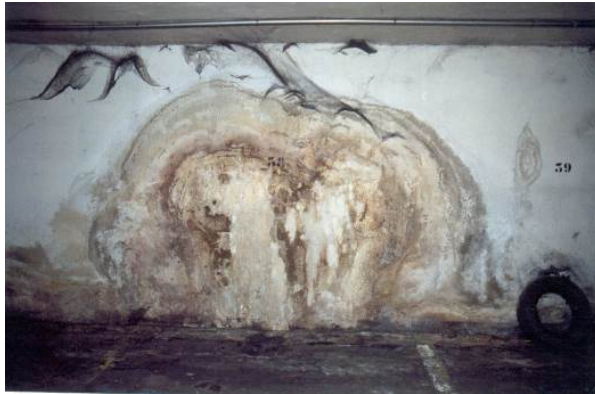
Fig. 3: Filtración a través de junta o fisuras