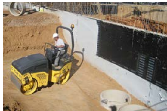
Fig. 2: Impermeabilización-capa drenante-compactación