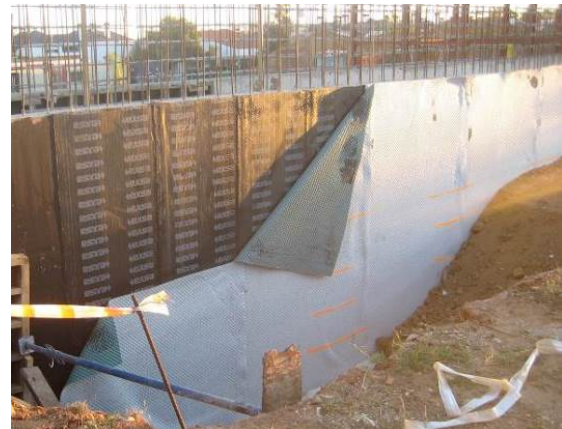
Fig. 6: Montaje lámina impermeabilizante + capa protectora