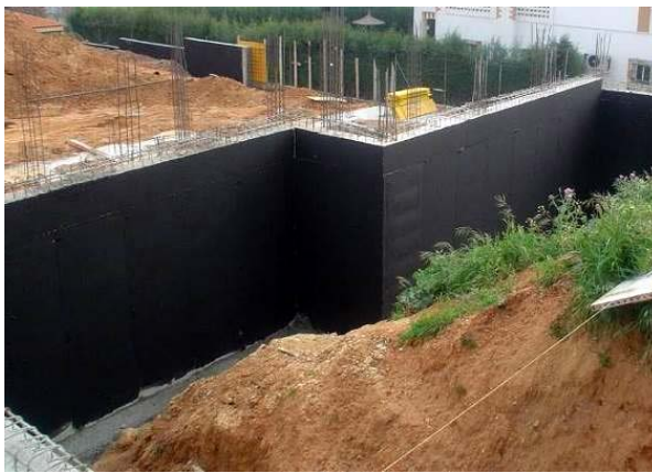
Fig. 5: Imprimación trasdós del muro