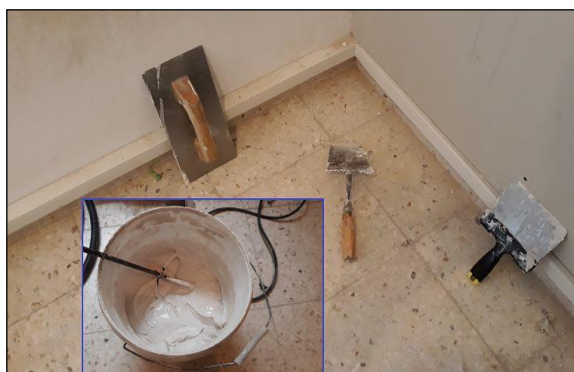
Fig. 2: Utensilios para PYL: batidora, fratás, paleta y espátula