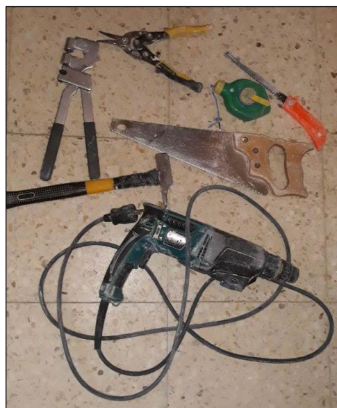
Fig. 5: Vista de algunas herramientas utilizadas para la ejecución de particiones de placas de yeso laminado

En el caso de puestas en obra automatizadas, habría que contar también con aplicadores y rodillos de rincón o esquina, bomba de carga, alimentador asistido, dispensadora de mezcla, encintadora automática, etc.