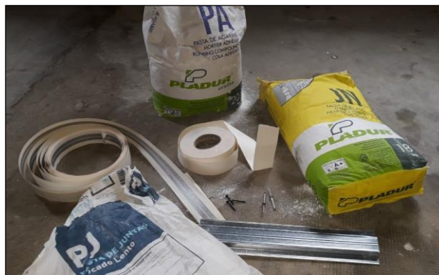
Fig. 4: Vista de algunos materiales usados para realización de particiones de placas de yeso laminado