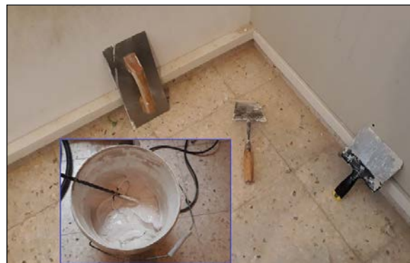
Fig. 2: Utensilios para PYL: batidora, fratás, paleta y espátula