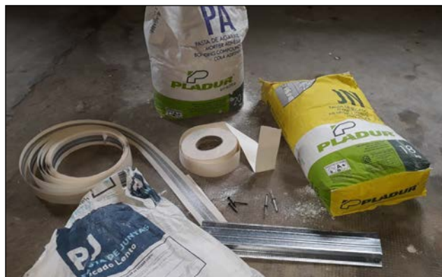
Fig. 4: Vista de algunos materiales usados para realización de particiones de placas de yeso laminado