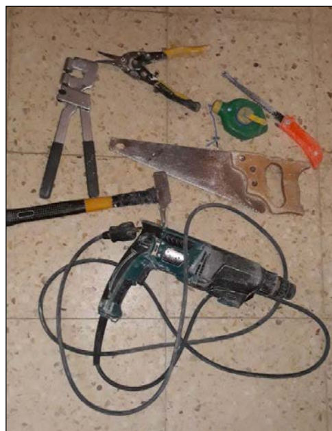
Fig. 5: Vista de algunas herramientas utilizadas para la ejecución de particiones de placas de yeso laminado

En el caso de puestas en obra automatizadas, habría que contar también con aplicadores y rodillos de rincón o esquina, bomba de carga, alimentador asistido, dispensadora de mezcla, encintadora automática, etc.