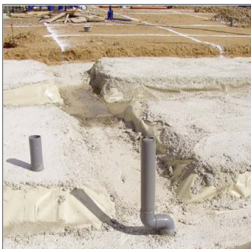
Fig. 6: Instalación de saneamiento colocada bajo una lámina de PVC y el hormigón de limpieza de una losa nervada de cimentación

En el diseño del trazado de la instalación se intentará que los colectores no atraviesen las vigas de cimentación (vigas centradoras y vigas de atado o riostras), sin bien esto no siempre es posible. Cuando los mismos no puedan pasar por encima o por debajo de éstas, discurrirán por el centro del canto de estas vigas, comprobándose especialmente que en ningún caso se corten las armaduras longitudinales. Puede pensarse, no obstante, adicionar armaduras a esta zona (aceros corrugados longitudinales y transversales) o incrementar también el volumen de hormigón (aumento de la sección resistente de la viga) en función de la merma que haya supuesto este encuentro (diámetro del colector frente a la escuadría de dicha viga).