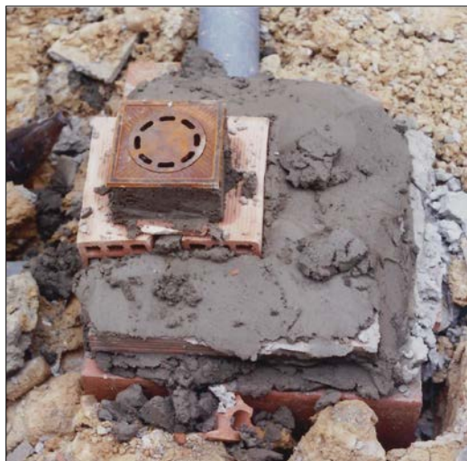
Fig. 4: Incorrecto diseño y ejecución de un sumidero de patio sobre una arqueta

Cuando sea necesaria la colocación de arquetas-sumidero, éstas se cubrirán con una rejilla metálica no oxidable, apoyada sobre angulares. Cuando estas arquetas tengan dimensiones considerables, como en el caso de rampas de garajes, la rejilla será desmontable. El desagüe se realizará por uno de sus laterales, con un diámetro mínimo de 110mm.