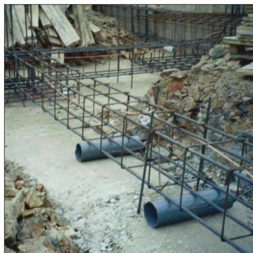
Fig. 7: Disposición de la red de saneamiento por debajo de las riostras, con colocación de pasatubos antes del hormigonado

En el caso de las arquetas, éstas jamás deberán coincidir dentro del volumen resistente de zapatas y zarpas, de su hormigón de limpieza, ni tampoco debajo de sus bulbos de presiones. En el caso de que la cimentación fuera mediante losa armada sí está permitido que las arquetas estén dentro, dada la envergadura volumétrica y forma de trabajo que tienen las losas, sin bien es muy conveniente que las arquetas queden alejadas de las zonas de mayor tensión que hay alrededor de la base de los pilares. En las losas de cimentación con 'refuerzos bajo columnas' o 'con pedestales', las arquetas no deberán nunca invadir estas partes. En las losas de tipo 'cajón', 'nervada' o 'aligerada' {ver Figura 3 del Documento de Orientación Técnica Cs-2} las arquetas se situarán preferiblemente en los huecos no resistentes.