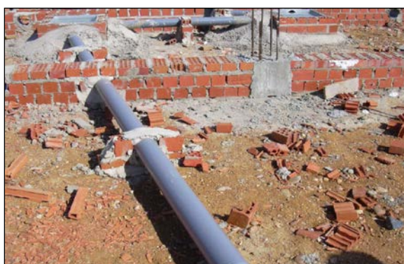
Fig. 2: Red de tipo 'oculta', dispuesta sobre apoyos de ladrillo

En edificación hay dos grandes divisiones que podemos realizar en la instalación de saneamiento. El saneamiento vertical (bajantes y tubos de ventilación) y el saneamiento horizontal (colectores y derivaciones).