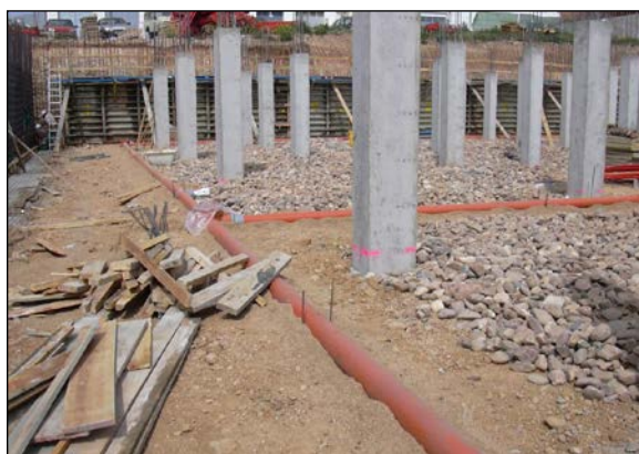
Fig. 1: Red de tipo 'cubierta', apoyada sobre cama de arena

La propia instalación y la cimentación aledaña