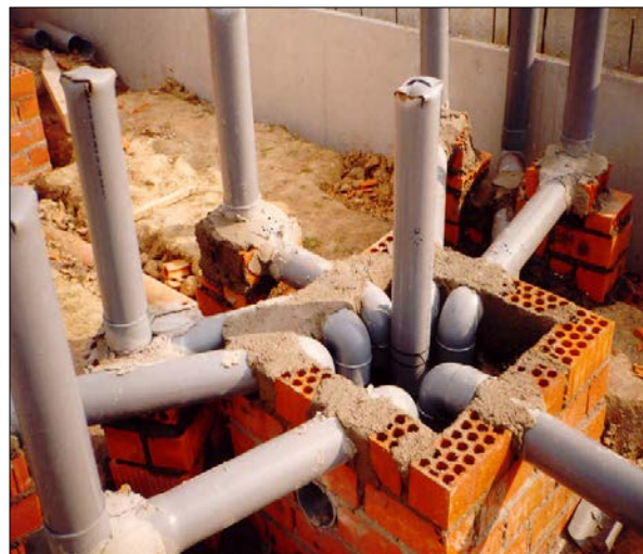
Fig. 5: Acumulación excesiva de tuberías por una falta de previsión en proyecto para el correcto cálculo de la red

Las uniones entre las arquetas y los colectores son encuentros especialmente críticos, dado que suelen ser puntos habituales de fuga, especialmente cuando las primeras son de fábrica de ladrillo y los segundos son tuberías de pared lisa exterior. Unos factores que aumentan este riesgo es la colocación de más de un colector en una misma cara de arqueta (algo a no permitir), y el que no se retaque y selle adecuadamente el contorno de las tuberías. En los casos de arquetas de materiales plásticos deberán usarse los adhesivos propios que sean compatibles con el material dispuesto en colector y arqueta.