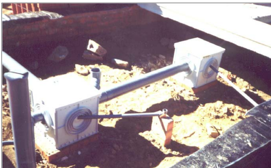
Fig. 8: Red de saneamiento bajo forjado sanitario realizada con arquetas prefabricadas y tuberías de PVC de pared lisa. Se observa que los apoyos están mal concebidos y no son suficientes.

Las arquetas que queden situadas por debajo de este forjado, deberán disponerse de forma que exista al menos 5cm de separación en vertical entre la cara superior de su tapa y la cara inferior del citado forjado sanitario (esto permitirá que no haya roturas en las arquetas, ni que existan apoyos imprevistos que puedan modificar eventualmente la ley de momentos flectores de las viguetas).