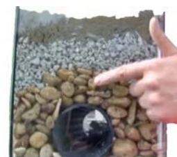
Fig. 8: Disposición del material granular

Idealmente, para que el funcionamiento del drenaje fuera óptimo, el material granular que se vierta encima de un tubo dren debería hacerse con el tamaño máximo de árido más grande cerca del mismo y el más pequeño en la parte más distante (grava, gravilla y arena-tierra); sin embargo, esto no siempre se hace así, pues la ejecución se hace más compleja y costosa. En cualquier caso, las condiciones mínimas a cumplir en el diseño/ejecución de los sistemas de drenaje respetarán el apartado 5.1.1.6 del CTE/DB-HS-1 (consultar también NTE-ASD -no preceptiva-).