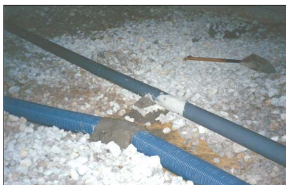
Fig.2: Redes de saneamiento y de drenaje (con encuentro incorrecto)