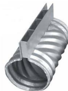
Fig. 7: Dren con abertura dorsal longitudinal