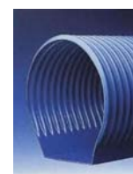
Fig. 3: Dren abovedado

En la medida de lo posible, es preferible el uso de tubos dren con la base ciega, en los cuales las ranuras solo estén por la parte superior (arcos de 120º o 240º); característica que habitualmente se da más en los tubos con dorso abovedado que en los de tipo cilíndrico. La preferencia de utilización de la primera tipología viene motivada porque al ser la parte inferior plana y sin orificios, permite una disposición más cómoda y segura, pues el asiento es más fácil y además la base al no tener ranuras hace que el agua que entra en el interior del conducto no salga por la parte inferior (lo que le quita eficacia y aumenta la pérdida de fluido antes de su transporte). No obstante, allí donde existan cargas de compresión importantes (p. ej. tráfico) es preferible el uso de los tubos cilíndricos pues éstos pueden llegar a soportar presiones sobre un 30% más que los abovedados, para igualdad de deformación de los tubos.