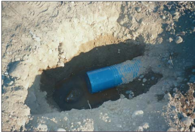
Fig. 9: Apertura de calicata en el terreno para comprobar las características del sistema de drenaje efectuado y del que había constancia que tenía problemas.

Dada su naturaleza, en esta unidad constructiva no es habitual que se realicen pruebas o ensayos. Eventualmente, podría efectuarse una prueba de verificación de la pendiente para constatar a grandes rasgos si existen problemáticas importantes. En casos de que haya indicios de éstas, o para la elaboración de peritajes, puede considerarse su realización para comprobar también si existen interrupciones en la instalación, faltan piezas especiales u otras situaciones análogas. En la Fig. 9 puede visualizarse una calicata en donde se pudo comprobar que el tubo dren no poseía continuidad en uno de sus extremos, la parte final del conducto no tenía puesto un tapón, no se había realizado una preparación para conformar la base de apoyo, y además, no se había colocado ni árido drenante ni geotextil.