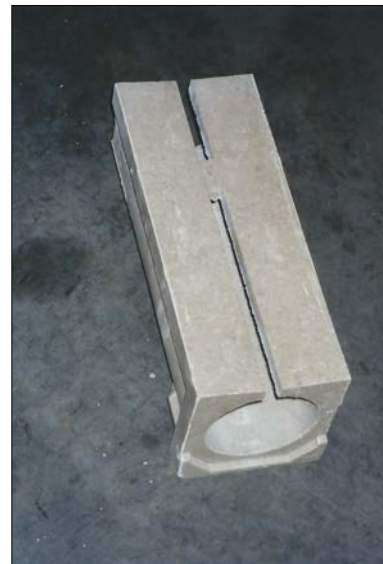
Fig. 10: Dren de canal de boca estrecha. Es un prefabricado de GRC para la canalización y drenaje superficial de las aguas de escorrentía de superficies o pavimentos colindantes a un edificio.

En relación al mantenimiento, es conveniente prever la colocación de arquetas de registro en aquellas redes de grandes longitudes o dimensiones, siempre que por su ubicación y profundidad esto sea posible. En caso de que las aguas deban ser impulsadas a una cota superior, la arqueta o pozo donde se ubique la bomba deberá ser siempre accesible para asegurar su fácil mantenimiento. Por su parte, cuando estén dispuestos drenes de recogida de aguas superficiales (Fig. 7 y 10) deberán preverse los registros necesarios para la limpieza y conservación de la instalación.