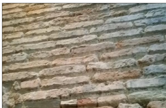
Fig. 2: Fábrica antigua con ladrillos del tejat dispuestos a soga