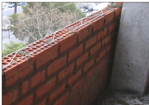
Fig. 1: Colocación de armadura de tendel en la hoja principal

Cuando tengamos fábricas armadas también puede haber problemas debidos a la corrosión de los componentes metálicos (armaduras de tendel, angulares de apoyo, rigidizadores transversales, etc.).