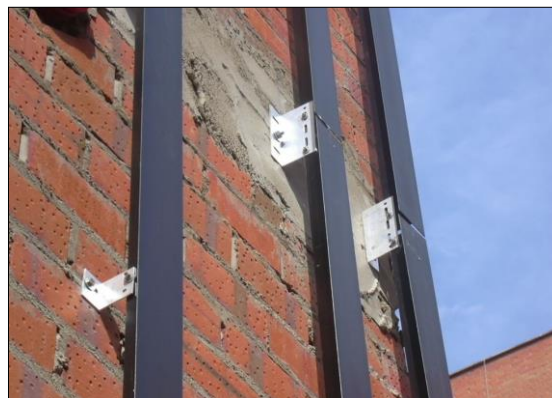
Fig.5: Colocación de los montantes y las escuadras de sustentación sobre la hoja principal de una fachada ventilada

A continuación, vamos a comentar ciertos aspectos de los materiales y piezas utilizadas para la capa de revestimiento exterior, en función de la utilización de algunos de los sistemas indicados en la Tabla 1.