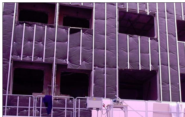
Fig.6: Fase de colocación de la subestructura de aluminio y del aislamiento en una fachada ventilada

En el diseño de la fachada es conveniente que se haya estudiado especialmente que las distancias horizontales entre ventanas, las distancias verticales entre dinteles de planta, las distancias con esquinas y rincones, las distancias con la altura de coronación de pretilas, etc., sean múltiplos exactos de las dimensiones de las piezas o baldosas (especialmente cuando el sistema es de piezas con junta abierta). Esta modulación permitirá no desperdiciar material, minimizar los procesos de corte en obra y evitar piezas o paneles en T o en L que pueden ser más propensos a fisurarse o desprenderse.