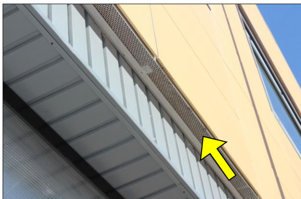
Fig.4: Vista de la rejilla inferior de ventilación de la cámara de aire de una fachada ventilada