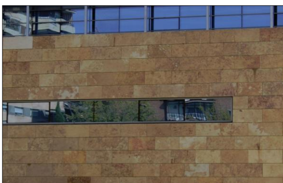
Fig. 2: Fachada ventilada con baldosas de piedra natural

Este Documento de Orientación Técnica es continuación del de 'Fachadas especiales: tipos y características generales (Fe-1)' y desarrolla dos tipologías que no fueron tratadas en el mismo. Las fachadas SATE (sistemas de aislamiento térmico por el exterior), la cual es un cerramiento con mucho futuro debido a las últimas modificaciones del CTE/DB-HE, así como las fachadas ventiladas , una tipología con más recorrido anterior. No hay que confundir este último tipo de fachada y denominación con la de las fachadas convencionales de ladrillo con cámara de aire interior aireada/ventilada; por tanto, las problemáticas y anomalías que pueden darse son diferentes puesto que el aislamiento está por delante, con una cámara de aire externa y un revestimiento con subestructura autoportante no estanco.