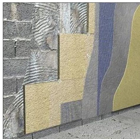
Fig.7: Infografía con la sucesión de capas a disponer en un sistema patentado de aislamiento térmico por el exterior

Como productos de aplicación superficial en húmedo, tendríamos: mortero de adherencia y uniformización (que debe poseer buenas características de adherencia y alto grado de deformabilidad; es la capa que se coloca entre el soporte y el aislamiento exterior), mortero de imprimación y regularización (capa situada sobre los paneles de aislamiento y previa a la aplicación del revestimiento, que contendrá la retícula de fibra de vidrio, y que mejora la absorción y la unión), y finalmente, morteros acrílicos para la realización del revestimiento exterior continuo (aplicados en capa fina para la impermeabilización, decoración y protección de la fachada).