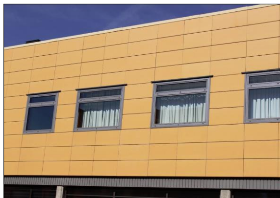
Fig. 1: Fachada ventilada con panel sintético rectangular

La propia fachada y sus zonas anexas habitables