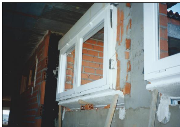
Fig. 1: Fijación de carpintería de aluminio y de vierteaguas

Denominamos ventana al hueco realizado en un paramento, a cierta altura del nivel del suelo, al objeto de proporcionar luz y ventilación, al cual se le incorpora un elemento constructivo opaco perimetral como bastidor, y al que se le adiciona un vidrio en su parte central. Esta disposición lleva pareja, en su caso, otros complementos como son persianas y contraventanas; estas últimas pueden ser exteriores (mallorquinas) o interiores (fraileros). A continuación, veremos las condiciones genéricas y específicas de proyecto que deben considerarse.