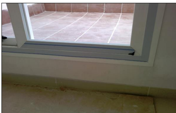
Fig. 2: Montaje de puerta corredera de acceso a una terraza