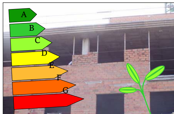
Fig. 2: La concepción térmica debe hacerse desde el proyecto