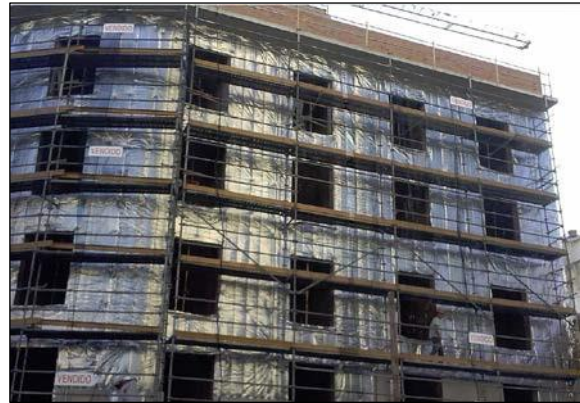
Fig. 1: Colocación de aislamiento de aluminio reflectivo

Los propios cerramientos y sus zonas anexas