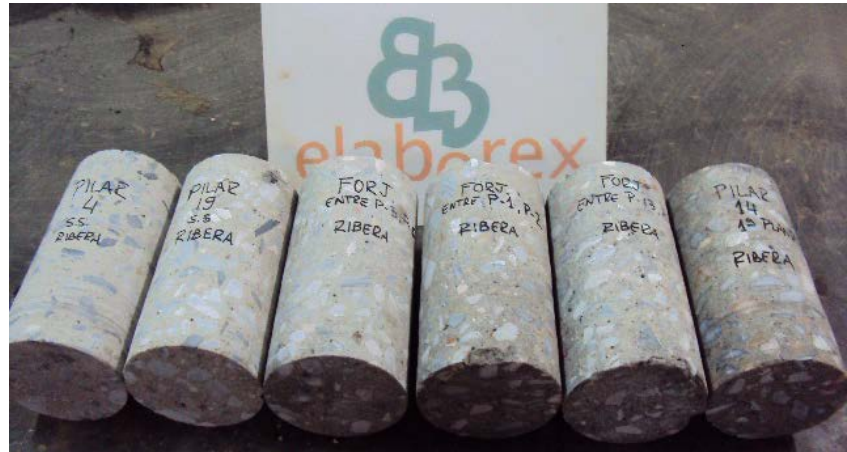
Fig. 12: Testigos de hormigón de 100 mm de diámetro

La norma UNE-EN 13791 sugiere que la evaluación de la resistencia del hormigón en una región determinada (uno o varios elementos estructurales que forman parte de la misma población), debe estar basada en los resultados de al menos tres testigos de 100 mm de diámetro. Para testigos de 50 mm de diámetro, el número se triplica.