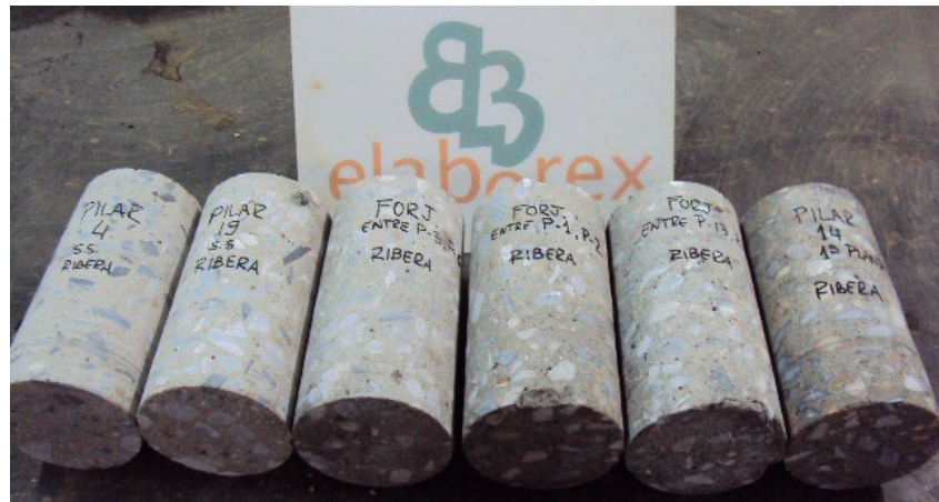
Fig. 12: Testigos de hormigón de 100 mm de diámetro

La norma UNE-EN 13791 sugiere que la evaluación de la resistencia del hormigón en una región determinada (uno o varios elementos estructurales que forman parte de la misma población), debe estar basada en los resultados de al menos tres testigos de 100 mm de diámetro. Para testigos de 50 mm de diámetro, el número se triplica.