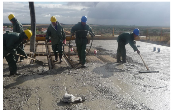
Fig. 5: Vertido y compactado del hormigón en obra