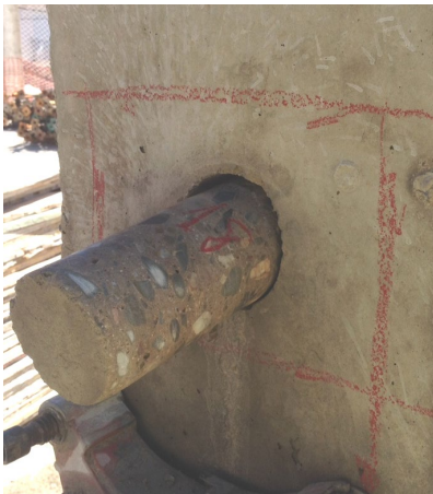
Fig. 11: Testigo de hormigón de 75 mm de diámetro en pilar

En los casos de estructuras densamente armadas pueden emplearse testigos de un diámetro de 75 mm si el tamaño máximo del árido es igual o menor de 20 mm .