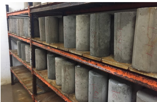
Fig. 6: Curado de probetas cilíndricas en cámara de húmedos