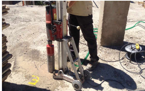
Fig. 1: Extracción probeta testigo de hormigón

La realización de los ensayos de información, su planificación, así como los estudios de seguridad y los proyectos de refuerzo, en su caso, requieren la intervención de técnicos especializados.