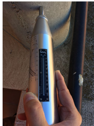
Fig. 9: Índice de rebote. Esclerómetro