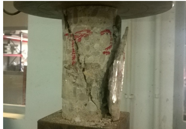
Fig. 2: Rotura a compresión probeta hormigón