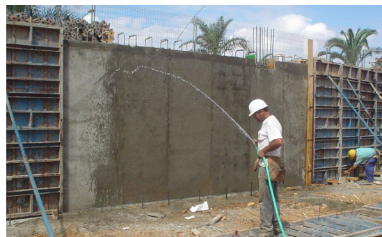
Fig. 7: Curado del hormigón en obra