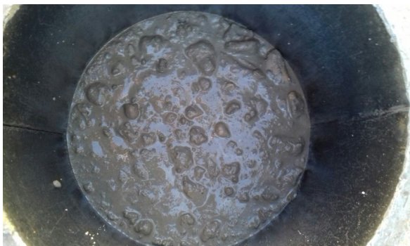
Fig. 4: Compactado de probetas cilíndricas

En este sentido, en la extracción de probetas testigos de hormigón en elementos verticales, como pilares y muros, dependiendo donde se produzca la extracción (parte superior o inferior), se pueden obtener valores de resistencia de los hormigones con diferencias notables (10 a 30%), como consecuencia del asentamiento del hormigón debido a una inadecuada consistencia y/o compactado.