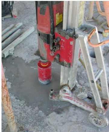
Fig. 8: Extracción probetas testigos

La dirección facultativa juzgará en cada caso los resultados, teniendo en cuenta que para la obtención de resultados de resultados fiables la realización, siempre delicada de estos ensayos, deberá estar a cargo de personal especializado.