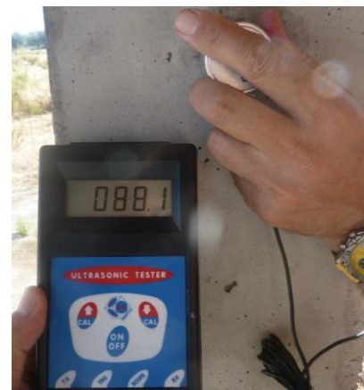
Fig. 10: Velocidad de propagación de ultrasonidos

En este documento nos vamos a centrar en los ensayos de información mediante la extracción y rotura a compresión de probetas testigos de hormigón.