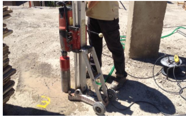
Fig. 1: Extracción probeta testigo de hormigón

La realización de los ensayos de información, su planificación, así como los estudios de seguridad y los proyectos de refuerzo, en su caso, requieren la intervención de técnicos especializados.