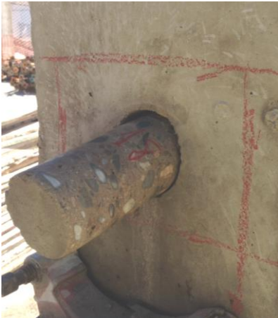
Fig. 11: Testigo de hormigón de 75 mm de diámetro en pilar

En los casos de estructuras densamente armadas pueden emplearse testigos de un diámetro de 75 mm si el tamaño máximo del árido es igual o menor de 20 mm .