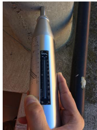
Fig. 9: Índice de rebote. Esclerómetro