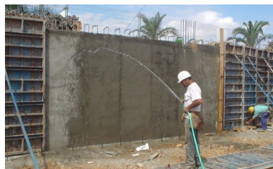
Fig. 7: Curado del hormigón en obra