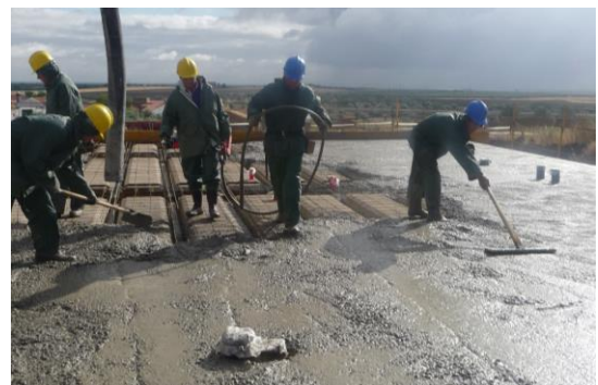
Fig. 5: Vertido y compactado del hormigón en obra