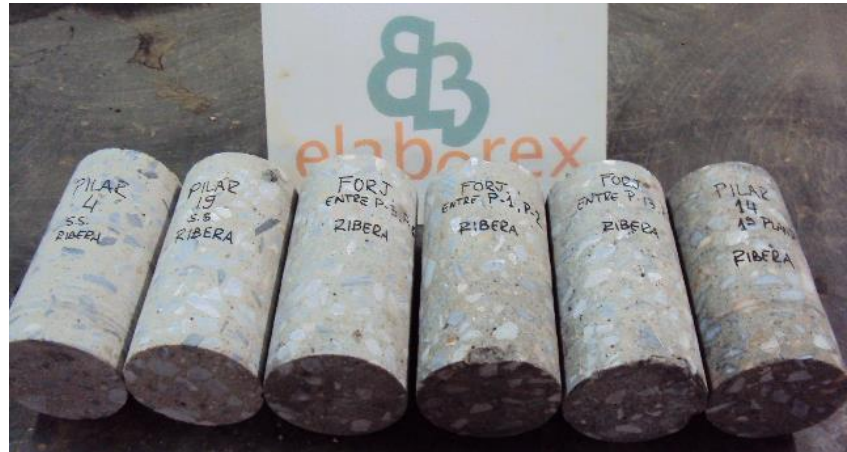
Fig. 12: Testigos de hormigón de 100 mm de diámetro

La norma UNE-EN 13791 sugiere que la evaluación de la resistencia del hormigón en una región determinada (uno o varios elementos estructurales que forman parte de la misma población), debe estar basada en los resultados de al menos tres testigos de 100 mm de diámetro. Para testigos de 50 mm de diámetro, el número se triplica.