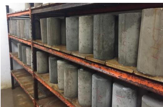
Fig. 6: Curado de probetas cilíndricas en cámara de húmedos