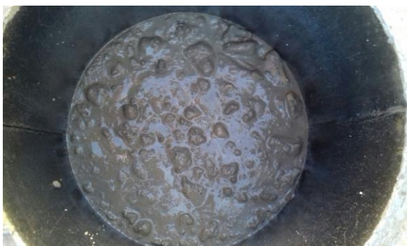
Fig. 4: Compactado de probetas cilíndricas

En este sentido, en la extracción de probetas testigos de hormigón en elementos verticales, como pilares y muros, dependiendo donde se produzca la extracción (parte superior o inferior), se pueden obtener valores de resistencia de los hormigones con diferencias notables (10 a 30%), como consecuencia del asentamiento del hormigón debido a una inadecuada consistencia y/o compactado.