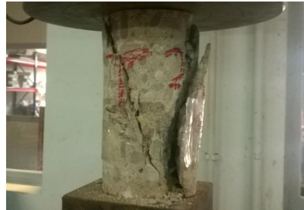
Fig. 2: Rotura a compresión probeta hormigón