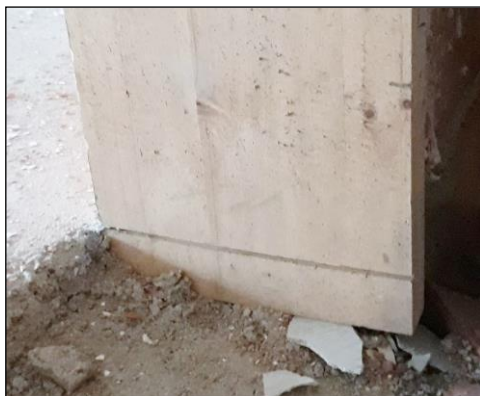
Fig. 5: Detalle de la entrega del larguero de un precerco de puerta, con empotramiento bajo la capa de compresión del solado realizada con mortero de cemento. ←