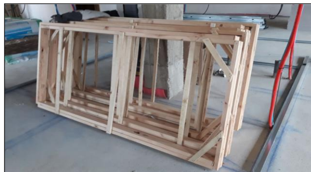
Fig. 3: Acopio en planta de varios precercos de madera de puertas de paso abatibles.

Cada partida que llegue a la obra tiene que estar acompañada de una documentación de suministro, emitida y facilitada por el fabricante del material, la cual debe poder identificar perfectamente el producto suministrado, así como garantizar las características técnicas del mismo. En el albarán de entrega se verificará la idoneidad de lo recepcionado respecto a lo previsto, así como hacer constar eventuales incidencias surgidas después del viaje.