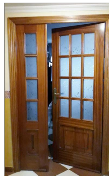
Fig. 8: Puerta vidriera de salón de dos hojas con diferente ancho

La pieza superior horizontal del tapajuntas es importante que esté nivelada, así como las verticales aplomadas, porque en caso contrario parecería que la puerta está girada o inclinada. La fijación de los tapajuntas debe de hacerse con grapas o saetines, y al tresbolillo, utilizándose una pistola neumática (en los extremos deben de clavarse en más número para dar mayor resistencia). Al no tener cabeza, se permite que puedan cubrirse con una masilla del mismo tono que la madera y pasen desapercibidos. Otra opción es colocar los tapajuntas con poliuretano, pero tiene el inconveniente que en caso de ser necesario que éstos se retiren más adelante, la operación resulte menos fácil. El uso del poliuretano también es más lento pues necesita la utilización de presillas o gatos mientras la espuma se endurece. Con cualquiera de los dos métodos hay que comprobar que queden perfectamente enrasados con el marco y con el revestimiento de la pared.