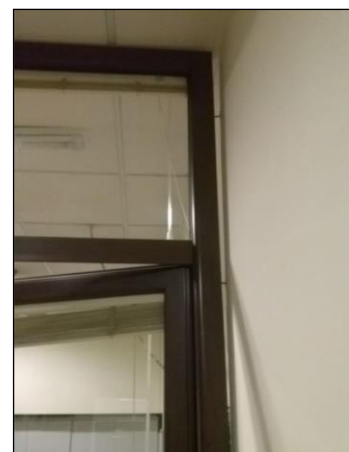
Fig. 9: Encuentro entre carpintería y una pared dejando una holgura excesiva entre ambos elementos.

El control de ejecución en sí, estará secuenciado y caracterizado en el Plan de Control de Calidad de la obra, en donde se especificarán los ítems de testeo/verificación, los lotes de muestreo estadístico y los criterios de aceptación/rechazo. En el proceso de control de ejecución es importante tener un mínimo de experiencia, de forma que puedan preverse o detectarse puntos críticos en la confluencia de la carpintería con otros elementos aledaños {ver Figura 9} que puedan distorsionar la calidad final del conjunto (con techos, suelos, rodapiés, distancias a sanitarios e instalaciones, etc.).