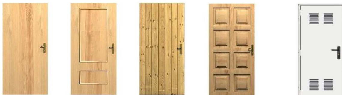
Fig. 10: Algunos ejemplos de modelos de hojas para puertas de madera: lisa, con moldura, entablada y con cuarterones plafonados. La última, es metálica lacada para un trastero

Una vez acabada la obra, en el libro del edificio, deberá haberse incluido la documentación final del producto, para lo cual el suministrador aportará: ficha técnica de la carpintería, documentación del origen de la madera, documento de conformidad o autorizaciones administrativas (marcado CE), sello de calidad (si dispone de él -AITIM o AENOR-) y ficha técnica de los elementos complementarios, herrajes y productos de acabado. Todo ello se acompañará con las correspondientes instrucciones de uso y mantenimiento.