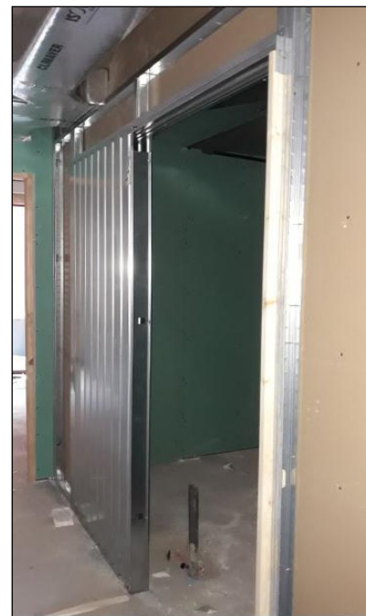
Fig. 6: Colocación de un 'kit' de precerco metálico empotrado para una puerta corredera en una tabiquería de placa de yeso laminado. →

Por su parte, hay que tener la precaución de que la longitud de los largueros se prolongue 3 por debajo del nivel del suelo acabado para dotarles de un empotramiento firme (si bien depende del tipo y modo de realización del pavimento). Es muy importante también que al precerco se le dote de una correcta nivelación y aplomado, para lo cual se utilizará un nivel de burbuja dispuesto sobre el dorso del testero y una plomada situada en contacto con los largueros; en caso contrario, el giro y cierre de la hoja podrían verse afectados muy negativamente.