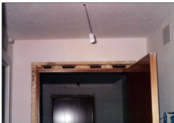
Fig. 1: Acuñado entre el marco de una puerta y su precerco

Como conocimiento general conviene recordar también otros posibles defectos genéricos de la madera natural, al objeto de poder identificarlos: nudos, fendas y rajaduras, acebolladuras, bolsas de corteza, bolsas de resina, lanulados, lagrimales, doble albura, alabeos (combadado, revirado, encorvadura...), etc.