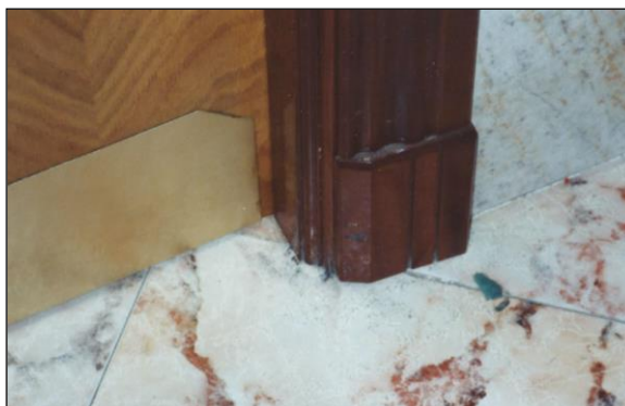
Fig. 2: Solución con sobre espesor en parte inferior del tapajuntas