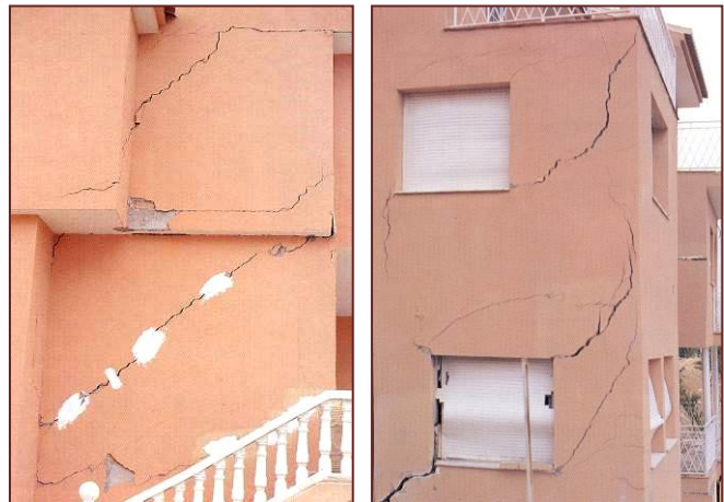
Figura 4: Cimentación en relleno. Asientos: Fisuras/grietas

Causas extrínsecas , debido a variaciones producidas en el edificio o en su entorno que modifican las características existentes, por ejemplo, las construcciones en las inmediaciones no previstas que provoquen descalces de la cimentación por desconfinamiento del relleno, vibraciones, variaciones en el nivel freático, fugas o escapes de agua, etc.