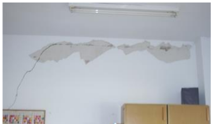
Figura 5: Cimentación en arcillas expansivas. Fisuras/grietas