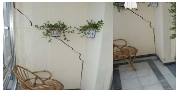
Figura 6: Invasión de cimentaciones próximas. Fisuras y/o grietas