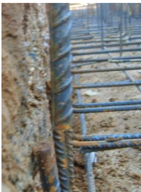
Figura 8: Inadecuado recubrimiento lateral de las armaduras con el terreno (Mínimo 7 cm).

El recubrimiento lateral de las puntas de las barras no será inferior a 70 mm.