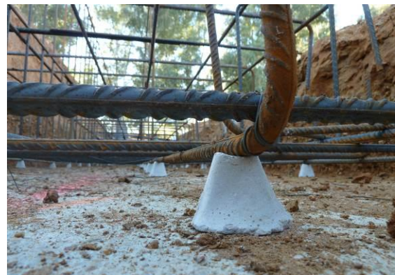
Figura 9: Recubrimiento de las armaduras. Colocación separadores

Hay que tener presente que un recubrimiento insuficiente puede ser la causa de entrada de agentes agresivos que corroen la armadura produciendo una pérdida progresiva de sección y la consiguiente reducción de la seguridad.