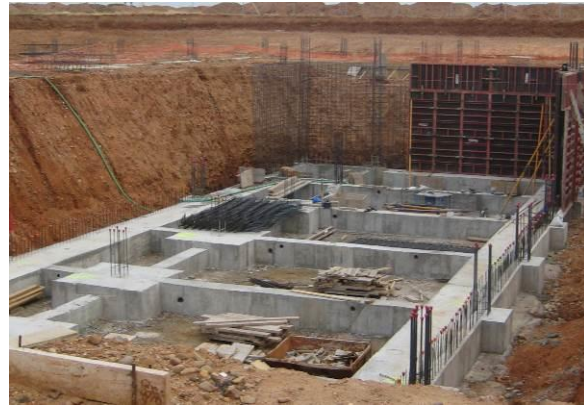
Figura 1: Ejecución de cimentación por zapatas

Las principales causas que pueden provocar la aparición de fisuraciones y/o grietas son debido a la interrelación entre la cimentación y estructura, debido a los movimientos diferenciales que pueden estar provocados por apoyos de la cimentación sobre materiales con distintas características geotécnicas, provocando distorsiones entre los elementos más sensibles a deformaciones.