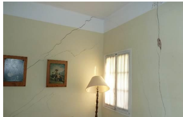
Figura 2: Lesiones por asientos de la cimentación