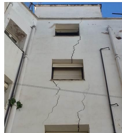
Figura 7: Fisuraciones por asentos de la cimentación

Se produce una fisura y/o grieta inclinada . Lo normal es que la fábrica se agriete en el sentido de su mayor resistencia, esto es en el sentido de la isostática de compresión. Por tanto, una grieta de asiento diferencial será inclinada descendiendo hacia la zona de terreno menos deformable..