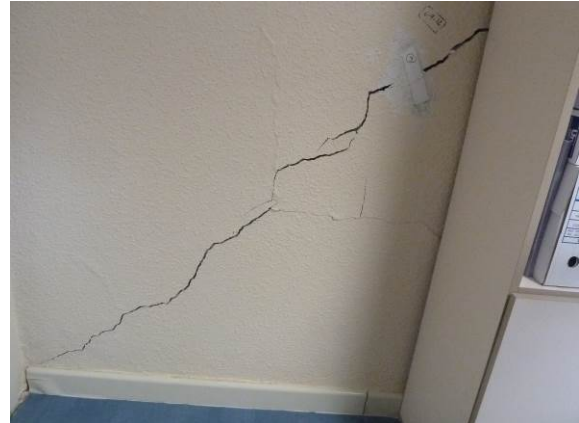
Figura 7: Fisuraciones por asientos de la cimentación

Se produce una fisura y/o grieta inclinada . Lo normal es que la fábrica se agriete en el sentido de su mayor resistencia, esto es en el sentido de la isostática de compresión. Por tanto, una grieta de asiento diferencial será inclinada descendiendo hacia la zona de terreno menos deformable.