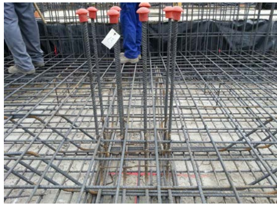
Figura 1: Ejecución de losa de cimentación