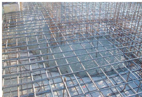
Figura 2: Hormigonado losa de cimentación