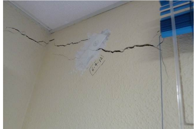
Figura 5: Cimentación en relleno. Asientos: fisuras/grietas

Causas extrínsecas , debido a variaciones producidas en el edificio o en su entorno que modifican las características existentes, por ejemplo, las construcciones en las inmediaciones no previstas que provoquen descalces de la cimentación por desconfinamiento del relleno, vibraciones, variaciones en el nivel freático, fugas o escapes de agua, etc.