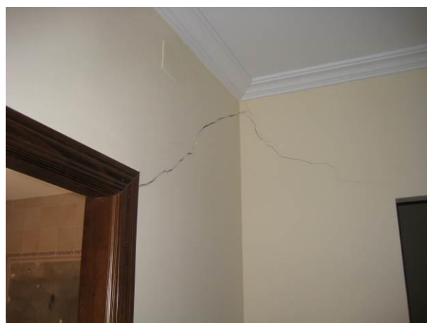
Figura 6: Cimentación en terreno expansivos: fisuras

La cimentación sobre arcillas expansivas es posible siempre y cuando se disponga de un completo estudio geotécnico, que permita al redactor del proyecto tomar las medidas adecuadas para cada situación y prever los sistemas necesarios para evitar o minimizar cualquier cambio de humedad en el terreno. Todo ello claro está, debe complementarse con la correcta ejecución y por supuesto con un mantenimiento adecuado.