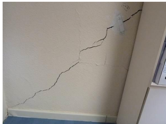
Figura 7: Fisuraciones por asientos de la cimentación

Se produce una fisura y/o grieta inclinada . Lo normal es que la fábrica se agriete en el sentido de su mayor resistencia, esto es en el sentido de la isostática de compresión. Por tanto, una grieta de asiento diferencial será inclinada descendiendo hacia la zona de terreno menos deformable.