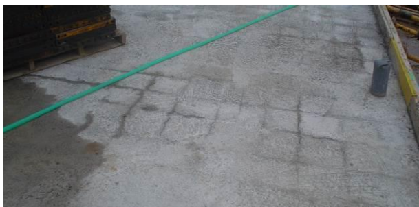
Figura 8: fisuras de retracción en losa de cimentación

El recubrimiento lateral de las puntas de las barras no será inferior a 70 mm.