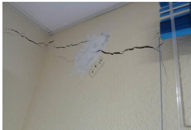
Figura 5: Cimentación en relleno. Asientos: fisuras/grietas

Causas extrínsecas , debido a variaciones producidas en el edificio o en su entorno que modifican las características existentes, por ejemplo, las construcciones en las inmediaciones no previstas que provoquen descalces de la cimentación por desconfinamiento del relleno, vibraciones, variaciones en el nivel freático, fugas o escapes de agua, etc.