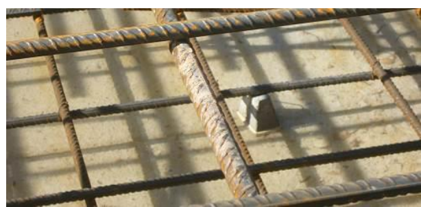
Figura 9: recubrimiento de las armaduras. Separadores