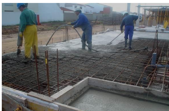
Figura 2: Hormigonado losa de cimentación