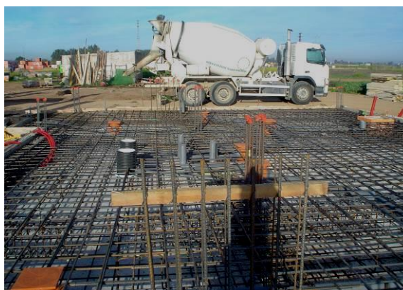
Figura 1: Ejecución de losa de cimentación