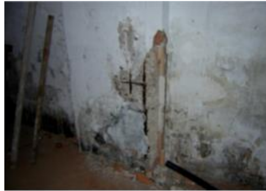
Fig. 1: Humedades