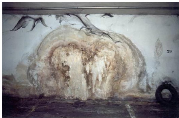
Fig. 3: Filtración a través de junta o fisuras