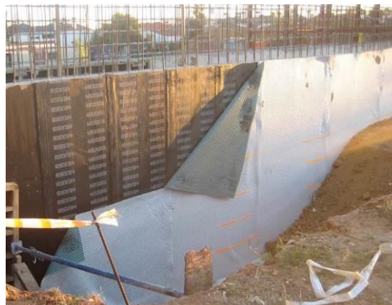
Fig. 6: Montaje lámina impermeabilizante + capa protectora