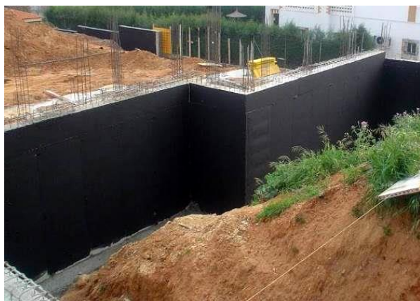
Fig. 5: Imprimación trasdós del muro