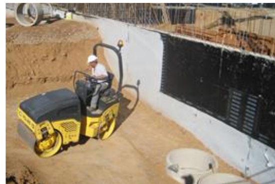
Fig. 2: Impermeabilización-capa drenante-compactación